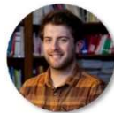
Thibault Dormois Communication